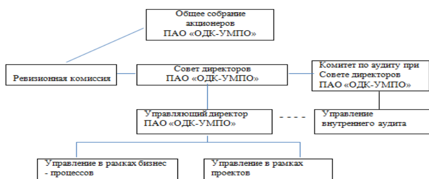
Схема 1 - участники системы управления рисками и внутреннего контроля

внутреннему контролю общества, приведены в таблице 12. Ответственность за эффективное управление рисками, организацию и осуществление внутреннего контроля в обществе возложена на управляющего директора общества. Заместители управляющего директора, руководители структурных подразделений являются владельцами рисков и отвечают за своевременное выявление, оценку рисков, разработку и формирование механизмов по управлению рисками. Работники общества участвуют в управлении рисками в рамках своих компетенций, знаний и зоны ответственности.